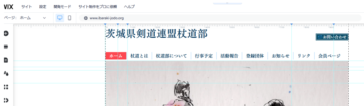
図 3 エディタ起動後「ホーム」が表示された状態